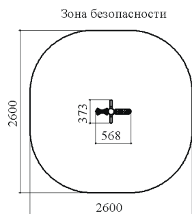
Рисунок 1. Минимальная зона безопасности тренажера «Массажер ног»